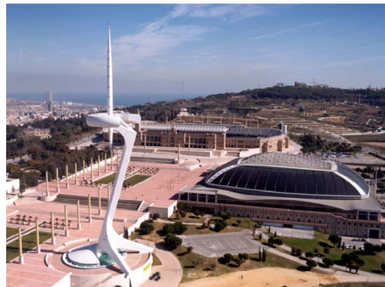
Sala Gaudí, Palau Sant Jordi de Barcelona